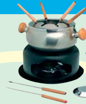
FONDUE DE METAL Y MADERA (*)