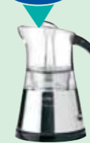
CAFETERA MOKA DE DISEÑO SOLAC