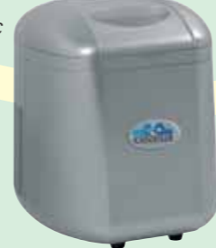
ICEMAKER (fabrica cubitos automáticamente)