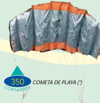
COMETA DE PLAYA (*)