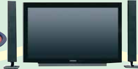
TV ELEGANCE 37" LXW PANORÁMICO GRUNDIG