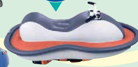
MOTO DE AGUA CON MOTOR