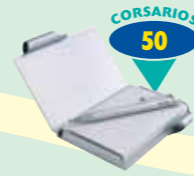
PORTA NOTAS ALUMINIO CON BOLÍGRAFO (*)