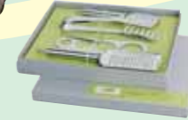
SET PASTA (*)