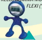
RELOJ ALARMA MULTIFUNCIÓN FLEXI (*)