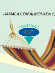
HAMACA CON ALMOHADA (*)