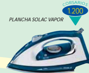
PLANCHA SOLAC VAPOR