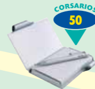
PORTA NOTAS ALUMINIO CON BOLÍGRAFO (*)