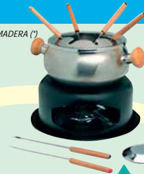
FONDUE DE METAL Y MADERA (*)