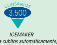
ICEMAKER (fabrica cubitos automáticamente)