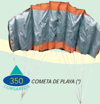
COMETA DE PLAYA (*)