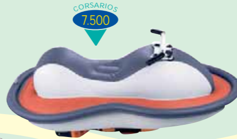
MOTO DE AGUA CON MOTOR