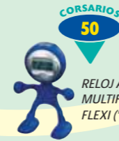
RELOJ ALARMA MULTIFUNCIÓN FLEXI (*)