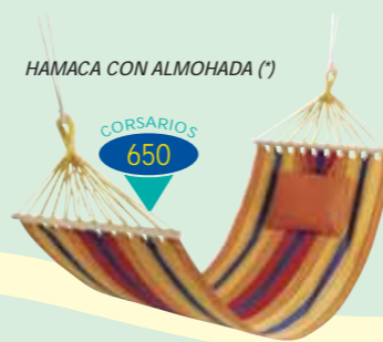
HAMACA CON ALMOHADA (*)