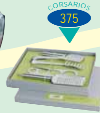
SET PASTA (*)