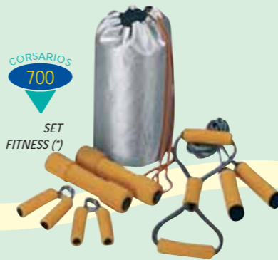
SET FITNESS (*)