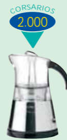
CAFETERA MOKA DE DISEÑO SOLAC