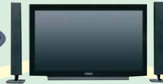
TV ELEGANCE 37" LXW PANORÁMICO GRUNDIG