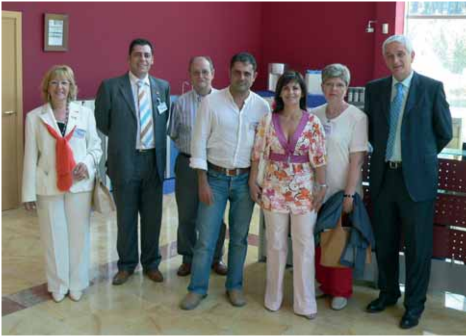
Visita a la Fábrica y al Servicio Técnico