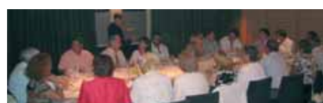
Imágenes de la cena en el Restaurante TEMPORADA