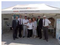
Parte del equipo comercial con su Directora al frente

Estas fotografías, tomadas en el muelle de Barcelona el día que el programa se realizó en esta ciudad, son fiel testimonio: