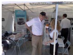
Luis del Olmo, de entrevistador a entrevistado

Nunca llueve a gusto de todos, dice la voz popular y mal iríamos si no fuera así, parecería que nos hubieran clonado. En Grupo CORSA estamos convencidos que la transparencia es la mejor actitud que se puede adoptar para tener y retener el favor de los clientes, por eso reproducimos las cartas/emails que hemos recibido y tratamos de contestarlas, con honestidad y con nuestras razones.