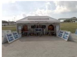
Carpa de Grupo CORSA